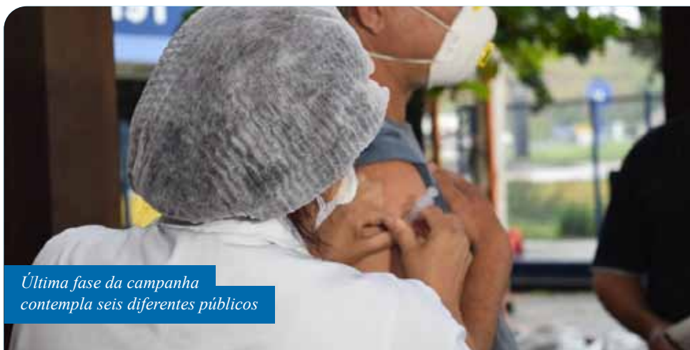
Última fase da campanha contempla seis diferentes públicos

“Além de resguardar as pessoas da gripe, a vacina ajuda os serviços de saúde na identificação de infecção por coronavírus, uma vez que os sintomas das duas enfermidades são semelhantes. Também por isso, é muito importante que as pessoas que fazem parte dos grupos da campanha busquem a imunização, o mais breve possível”, frisa a secretária de