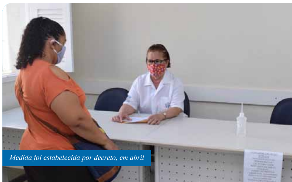
Medida foi estabelecida por decreto, em abril

a infecção, conforme decreto nº 29.350. Para os funcionários municipais, foram adquiridas cerca de 6 mil máscaras e distribuídas centenas de outras confeccionadas na Casa da Costura, da própria administração municipal.