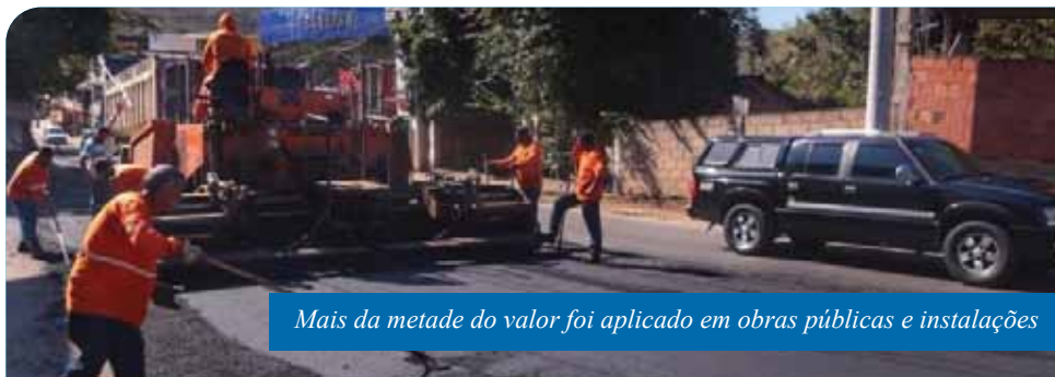
Mais da metade do valor foi aplicado em obras públicas e instalações