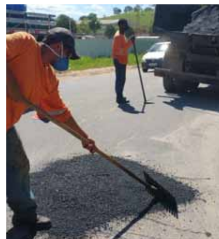
Serviço de tapa-buracos foi realizado na rodovia do Gavião, no Aeroporto

Os moradores de Cachoeiro podem solicitar os serviços de manutenção de vias pelos canais da Ouvidoria Geral do Município, que são os seguintes: telefone 156, aplicativo “TodosJuntos”, site www.cachoeiro.es.gov.br/ouvidoriageral e WhatsApp 98814-3357.