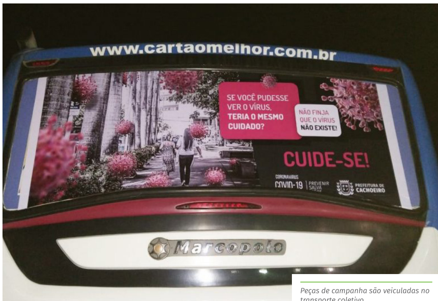
Peças de campanha são veiculadas no transporte coletivo

No portal da Prefeitura de Cachoeiro, o cachoeirense tem acesso a informações sobre transmissão do coronavírus, sintomas, formas de prevenir o contágio, como deve ser o atendimento a pacientes e o boletim epidemiológico, com o número de casos registrados no município. O endereço é cachoeiro.es.gov.br/novocoronavirus .