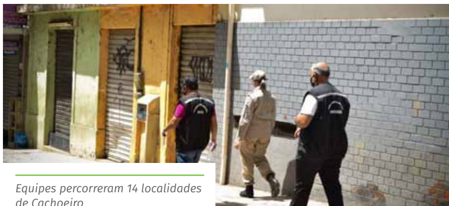
Equipes percorreram 14 localidades de Cachoeiro

Para denúncia de desrespeito às medidas restritivas, a população pode acionar o Disk Aglomeração, pelo telefone 153, pelo site www.cachoeiro.es.gov.br/ouvidoriageral ou pelo aplicativo de celular “Todos Juntos”. A central funciona 24 horas.