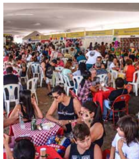
Evento, que acontece em setembro, é oportunidade para conhecer e apoiar ações sociais

“A mobilização de grupos ou associações, para alcançar determinados objetivos, facilita e fortalece o propósito quando outras pessoas tomam conhecimento da causa. O aumento da participação das entidades, a cada ano na feira, contribui para a satisfação nos resultados. Com o evento, viabilizamos a maior participação das pessoas e, também, possibilitamos diálogos