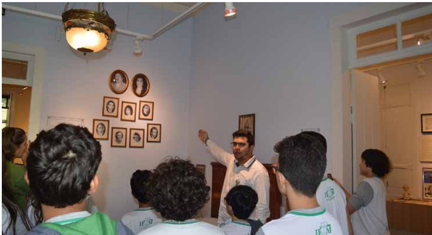
Organizada pela Semcult, programação é inteiramente gratuita

Nesta semana, a Secretaria de Cultura e Turismo de Cachoeiro de Itapemirim (Semcult) celebrará a memória do escritor Newton Braga (1911-1962), um dos filhos mais ilustres do município, com uma série de atividades alusivas à data de seu nascimento (11 de agosto).