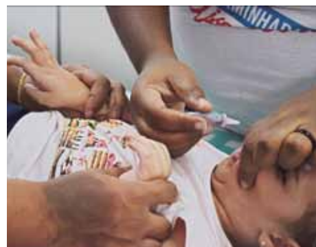
Todas as crianças de 1 ano até menores de cinco anos devem ser vacinadas

e adultos por meio do contato direto com fezes ou com secreções eliminadas pela boca das pessoas infectadas e provocar ou não paralisia. Nos casos graves, em que acontecem as paralisias musculares, os membros inferiores são os mais atingidos. Como resultado da intensificação da vacinação, no Brasil, não há circulação de poliovírus selvagem (da poliomielite) desde 1990.