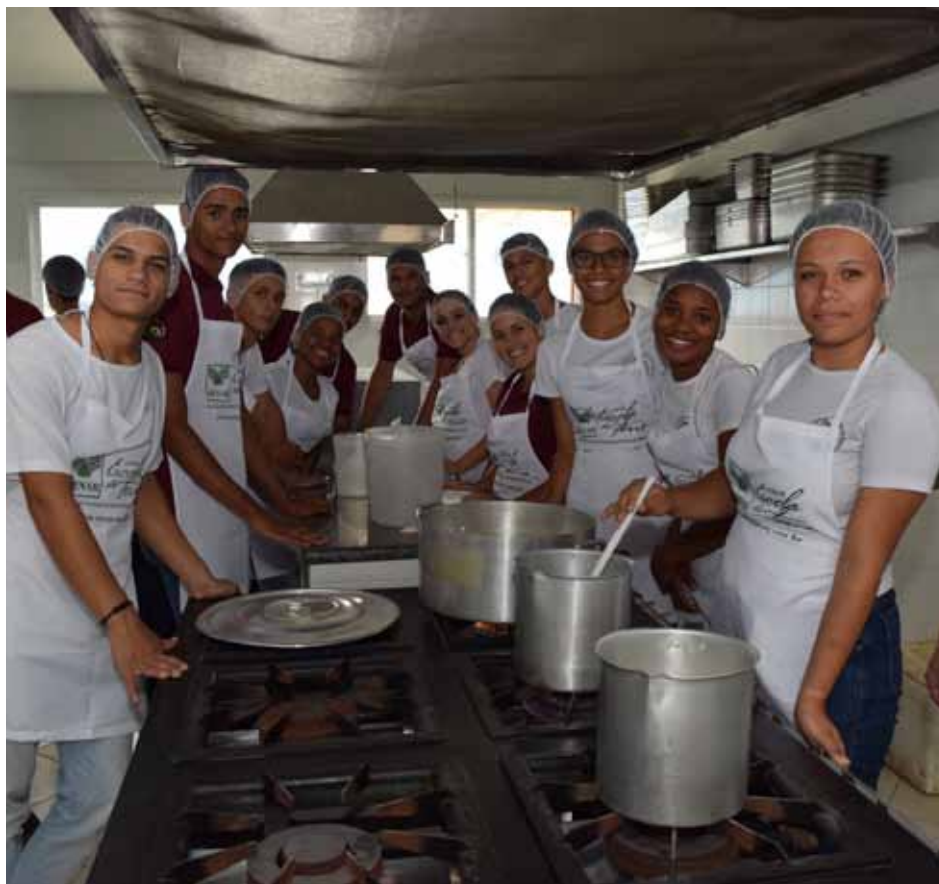
Objetivo é que estudantes adquiram qualificação em atividades agroindustriais

Também em parceria com o Senar, deverá ser realizado, no mês de setembro, na Cozinha Comunitária de Itaoca, um curso sobre preparação de doces e compotas para usuários dos centros de