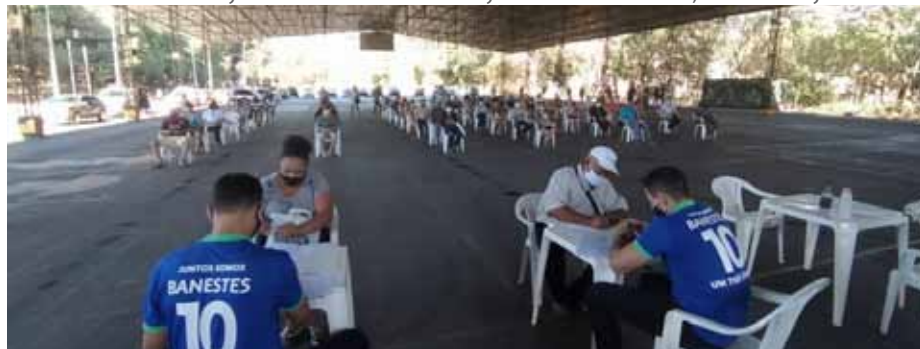
Convocados devem fazer a retirada do benefício na Ilha da Luz, na data informada

A Semdes também entrará em contato com os beneficiários listados para reforçar a data de entrega do cartão. Todos os convocados devem comparecer apenas no dia marcado, portando documento de identificação com foto (identidade, habilitação ou carteira de trabalho) e usando máscara de proteção contra o coronavírus, obrigatoriamente. Todos os protocolos sanitários de prevenção serão adotados durante a entrega do benefício.