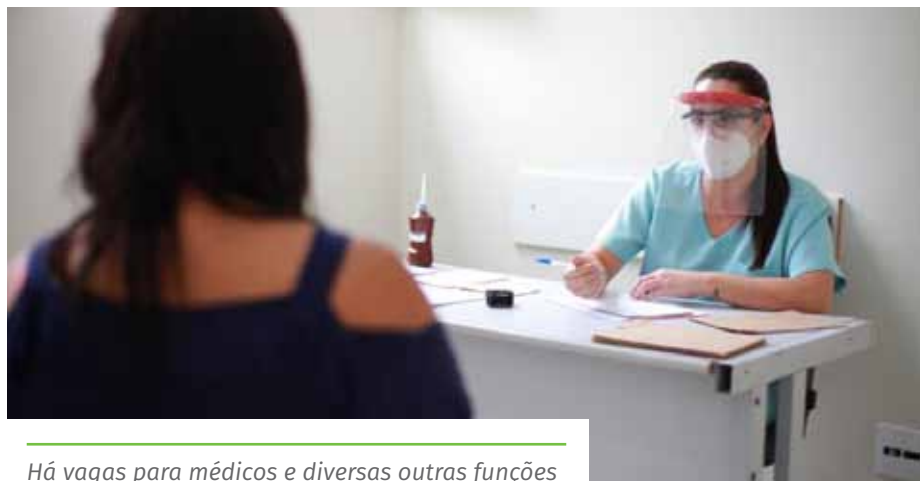
Há vagas para médicos e diversas outras funções

classificação preliminar será divulgada no dia 4 do mesmo mês, a partir das 17h, no site da Prefeitura.