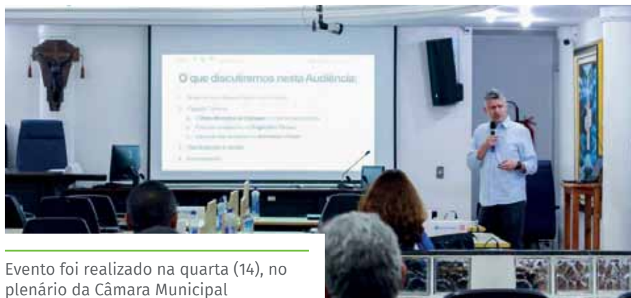
Evento foi realizado na quarta (14), no plenário da Câmara Municipal

Para quem deseja contribuir com a construção do Plano, há um formulário on-line disponível no endereço: bit.ly/3xvK3rV