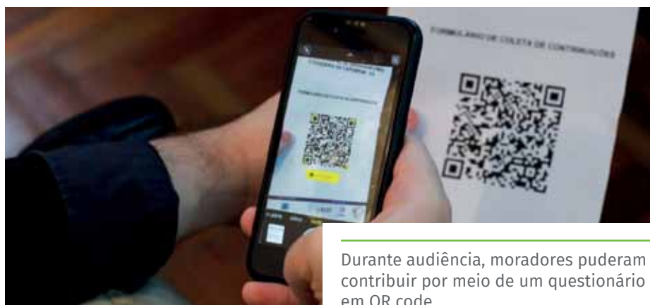
Durante audiência, moradores puderam contribuir por meio de um questionário em QR code